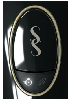
Brzi način rada – uključeni pokazatelj

Snažni način rada postavka je najvišeg trošenja energije uređaja. Snažnim načinom rada postižu se najbolji rezultati jer se njima upotrebljava maksimalna snaga za vašu jedinstvenu boju kože. Ovaj način rada osobito dobro djeluje na tvrdokornim područjima gdje su dlačice gušće, kao što su pazusi i bikini linija.