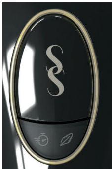
Snažni način rada – nema pokazatelja

Možete tretirati svoje tijelo pomoću bilo kojeg od tri načina rada za tretman uređaja SMOOTHSKIN PURE: